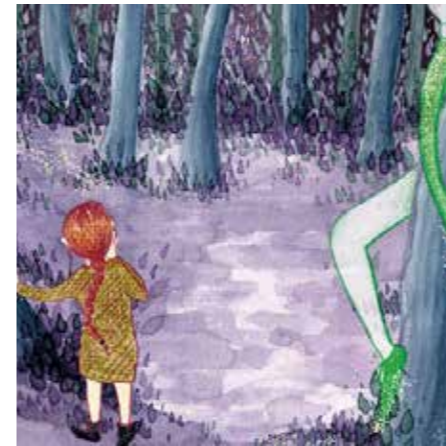
Kinderbuch von Lene Leu