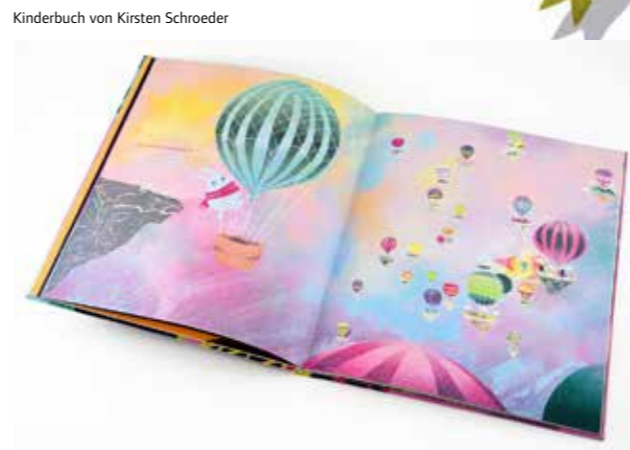
2 | 3 AID Berlin Kinderbuchillustration