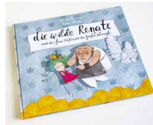
Kinderbuch von Sophia Schrade