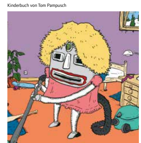
Kinderbuch von Tom Pampusch