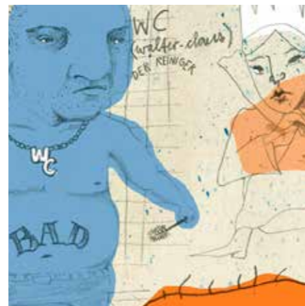
Kinderbuch von Lina Ernst